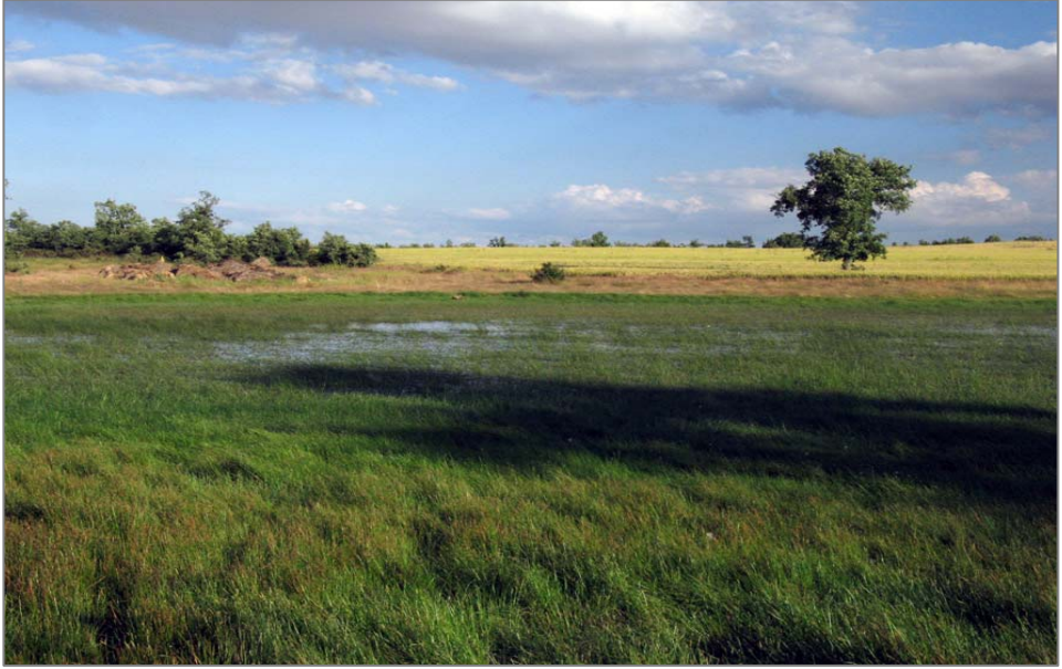
Figura 4. Rabanera del Campo, laguna del Ciego