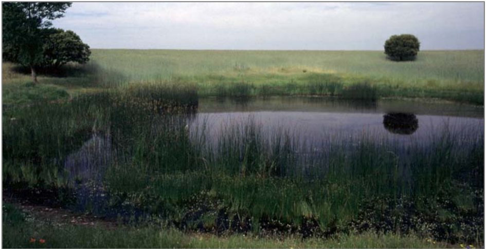
Figura 5. Tardajos de Duero, laguna de Blasco Nuño